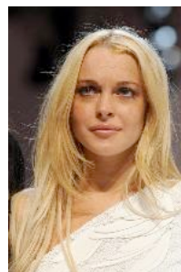
Lindsay Lohan horroriza a la crítica en su debut para Ungaro