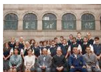
Antena 3 estrena 'Curso del 63'